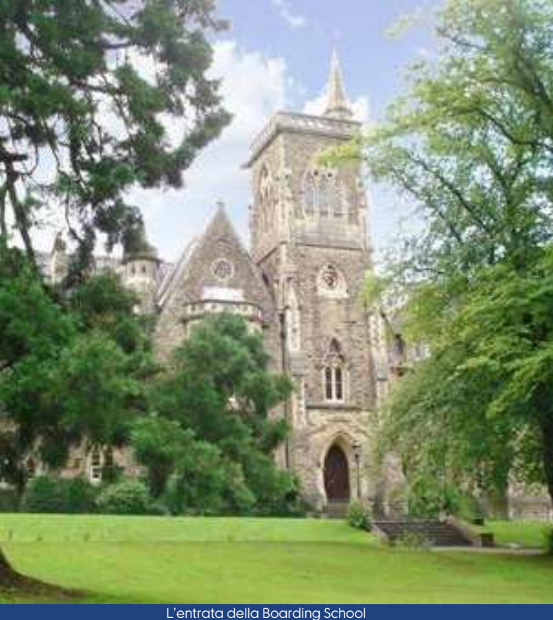
L'entrata della Boarding School

Un po' di studio e poi tutti alla scoperta della città