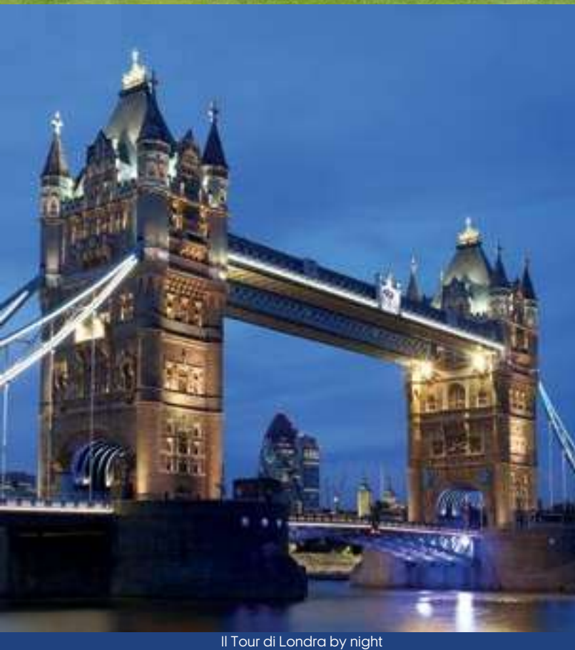
Il Tour di Londra by night