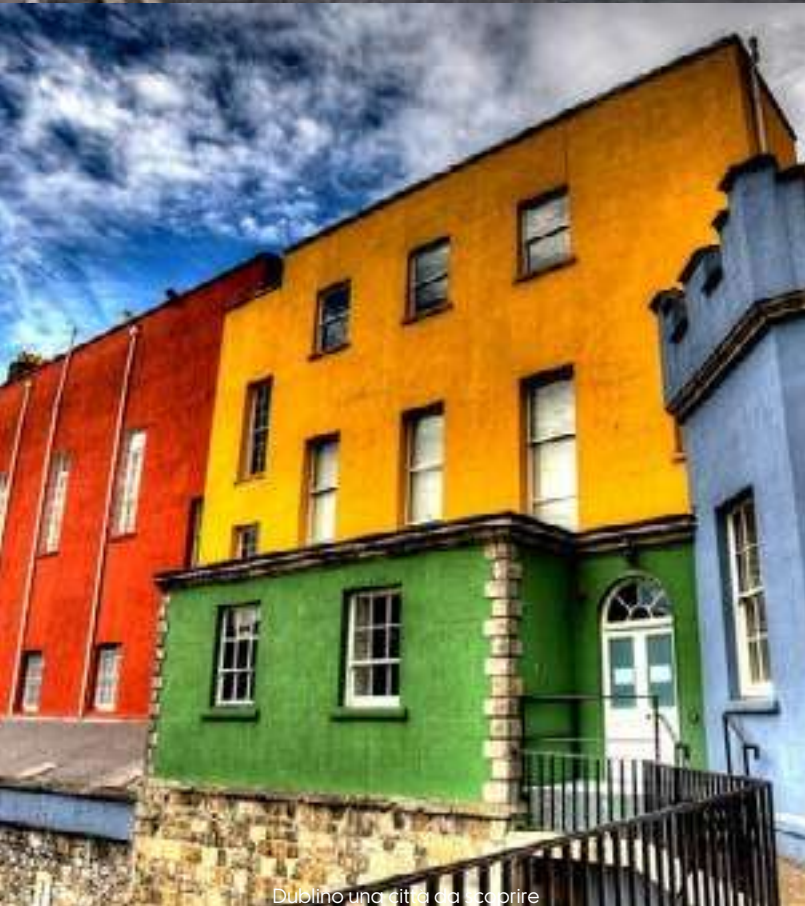
Dublino una città da scoprire