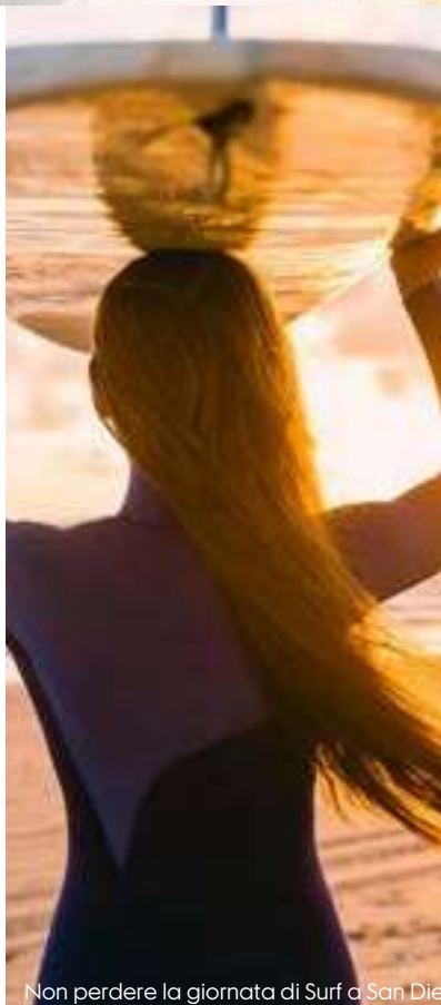
Non perdere la giornata di Surf a San Die

Le escursioni in programma sono tutte organizzate in bus privato.