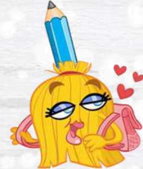
CLASS BROOM LA SCOPETTA DI CLASSE