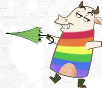
RAIN COW LA MUCCA DA PIOGGIA