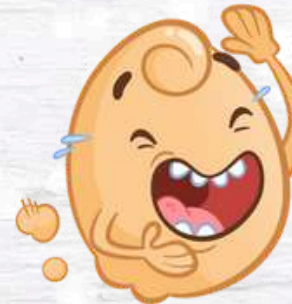
EGG SMELL L'OVETTO PUZZOSO