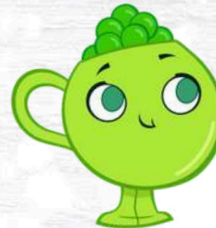
PEA CUP LA TAZZA PISELLINA