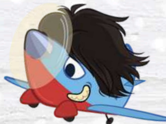
HAIR PLAN L'AEREO CAPELLONE