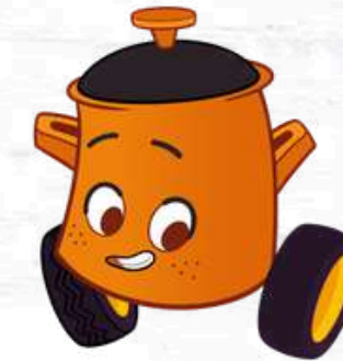
PARKING POT IL PENTOLINO PARCHEGGINO