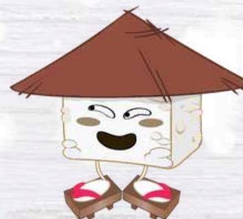
RICE CUBE IL CUBETTO DI RISO