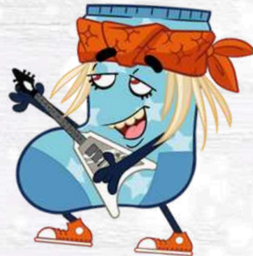
SOCK STAR IL CALZINO SUPERSTAR