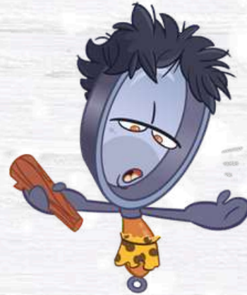
CAVE PAN IL PADELLONE PREISTORICO