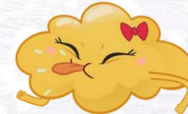
LEMON FART LA PUZZETTA AL LIMONE