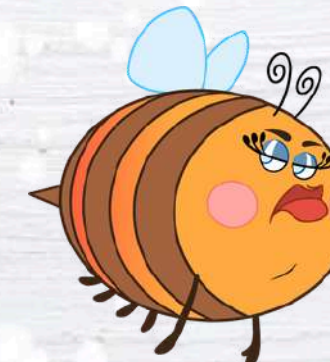
FUMBLE BEE L'APE PESTIFERA