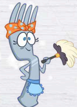
HOME FORK LA FORCHETTA CASALINGA