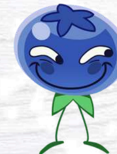
GLUE BARRY IL MIRTILLO APPICCICHINO